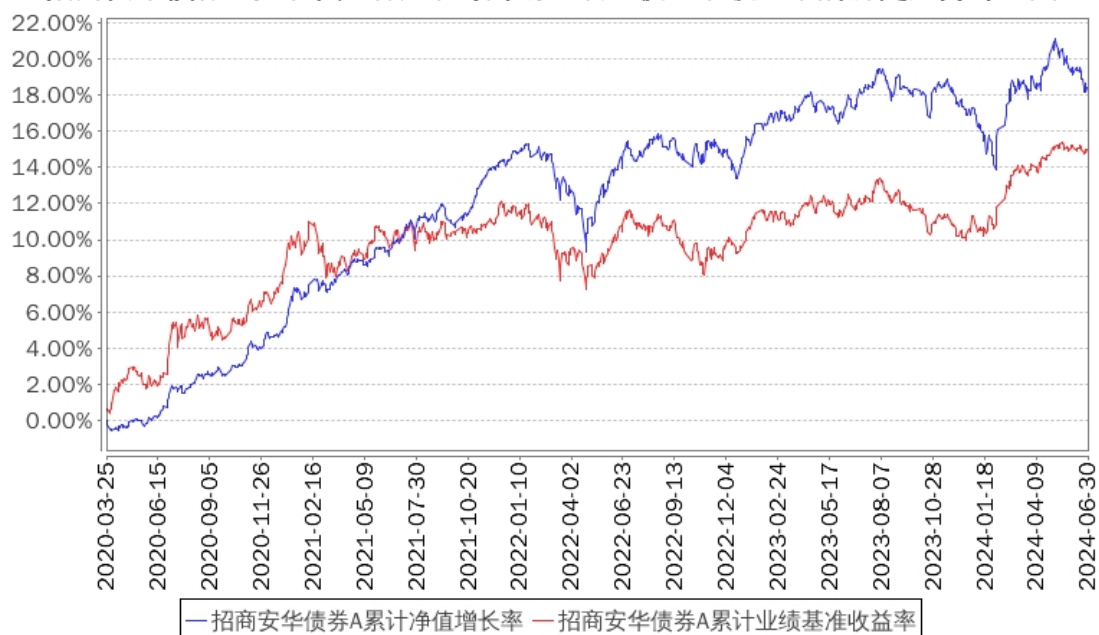
招商安华债券A累计净值增长率与同期业绩比较基准收益率的历史走势对比图