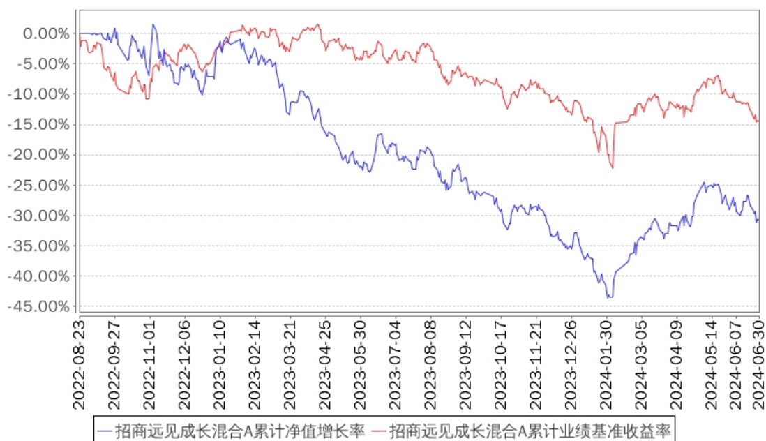
招商远见成长混合A累计净值增长率与同期业绩比较基准收益率的历史走势对比图