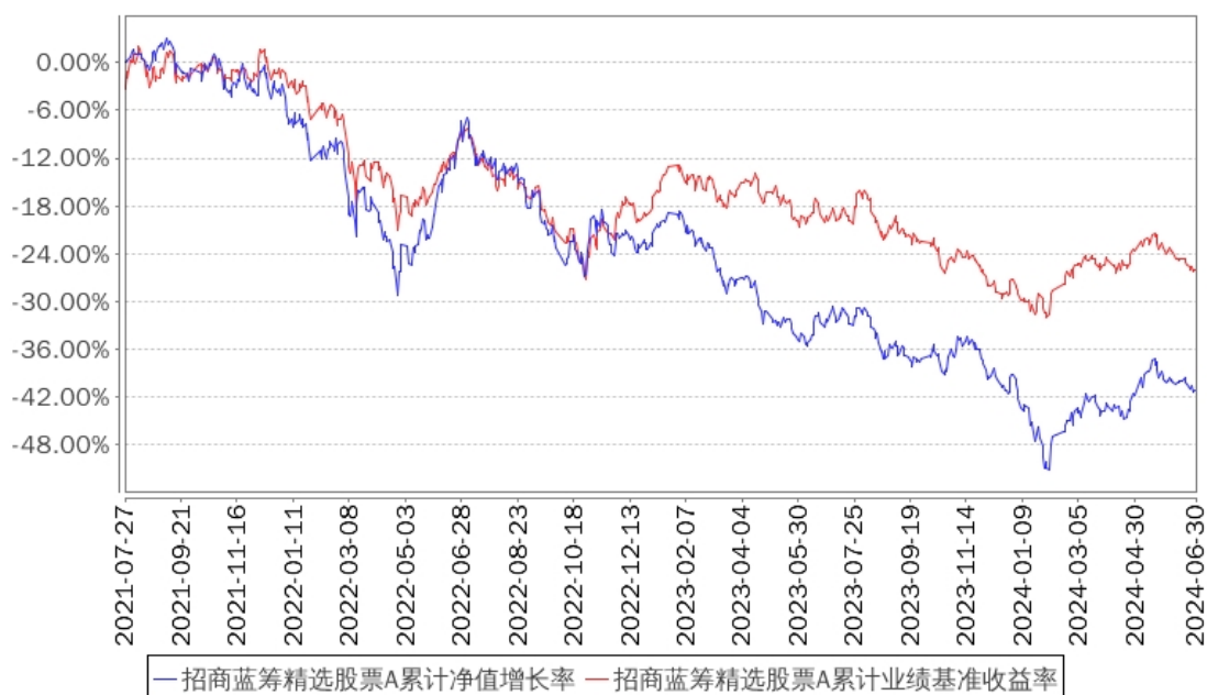
招商蓝筹精选股票A累计净值增长率与同期业绩比较基准收益率的历史走势对比图