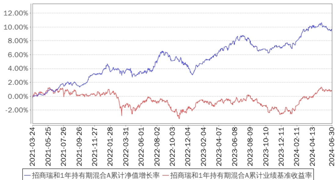
招商瑞和1年持有期混合A累计净值增长率与同期业绩比较基准收益率的历史走势对比图