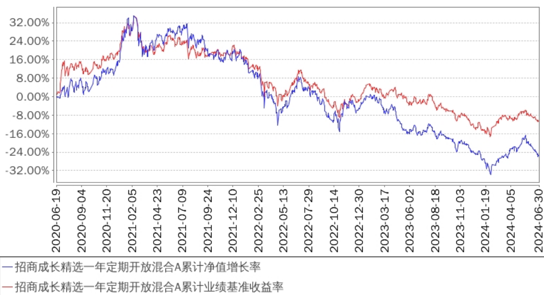
招商成长精选一年定期开放混合A累计净值增长率与同期业绩比较基准收益率的历史走势对比图