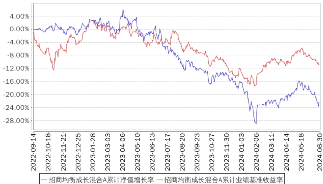
招商均衡成长混合A累计净值增长率与同期业绩比较基准收益率的历史走势对比图