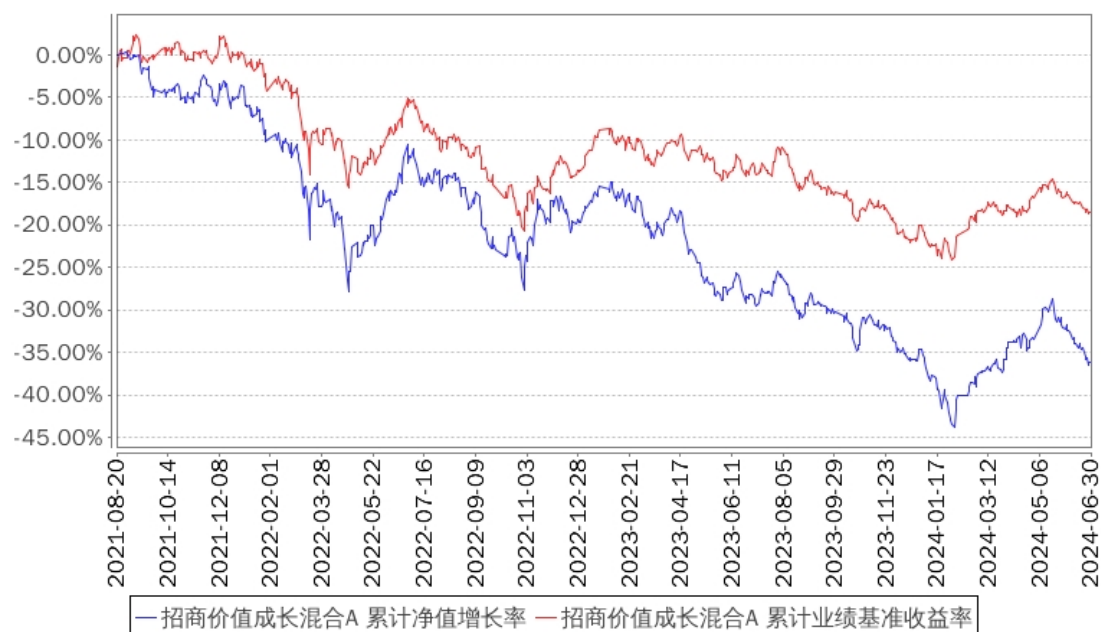
招商价值成长混合A 累计净值增长率与同期业绩比较基准收益率的历史走势对比图