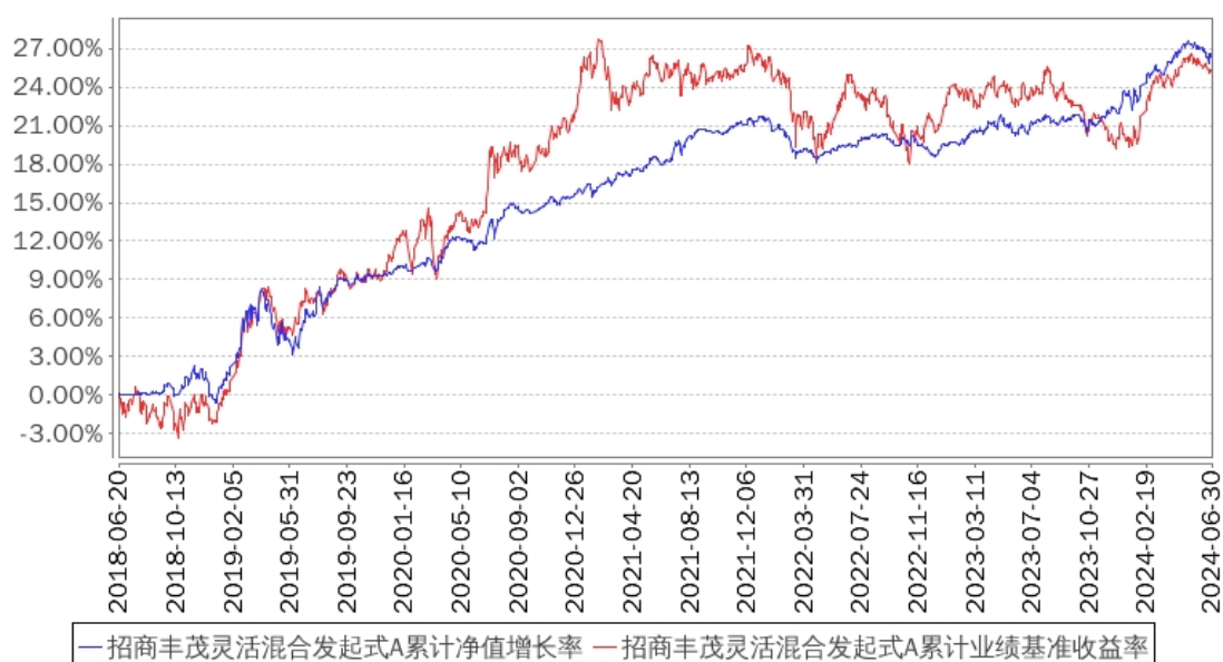
招商丰茂灵活混合发起式A累计净值增长率与同期业绩比较基准收益率的历史走势对比图