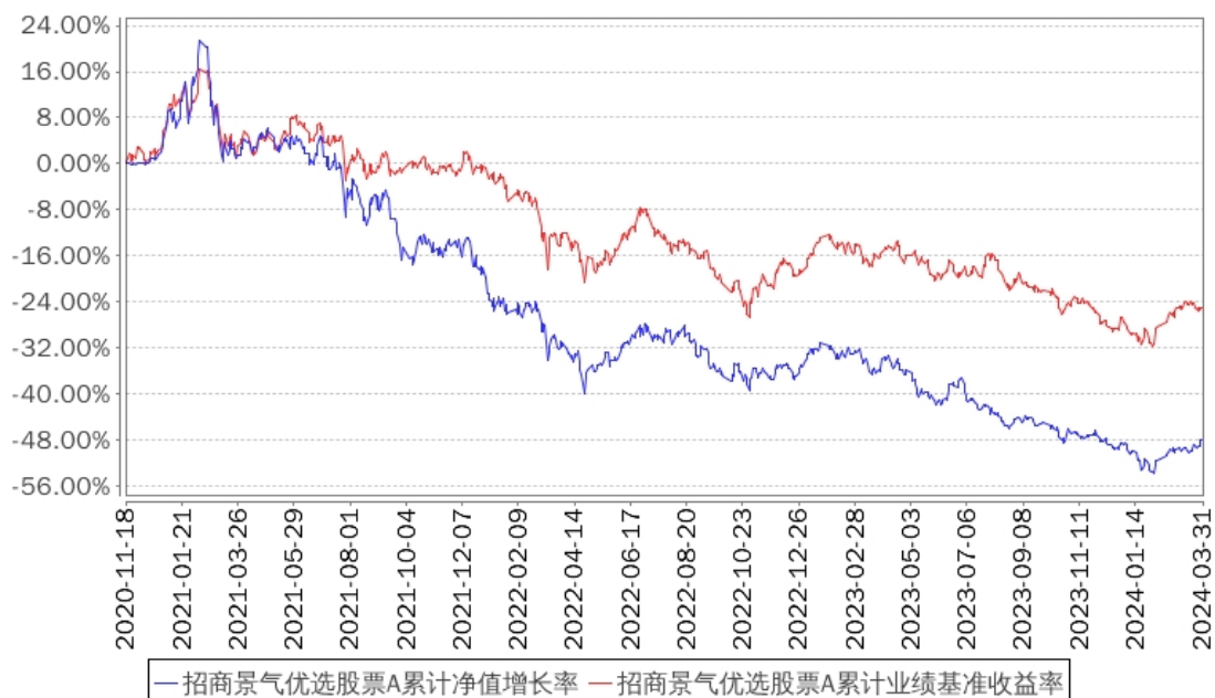
招商景气优选股票A累计净值增长率与同期业绩比较基准收益率的历史走势对比图