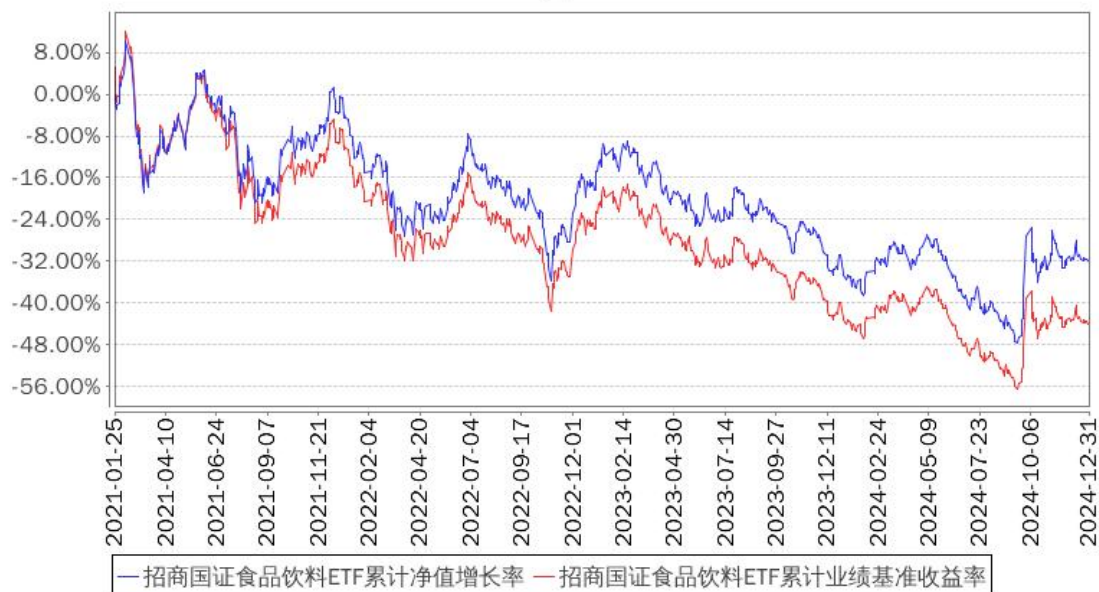
招商国证食品饮料ETF累计净值增长率与同期业绩比较基准收益率的历史走势对比图