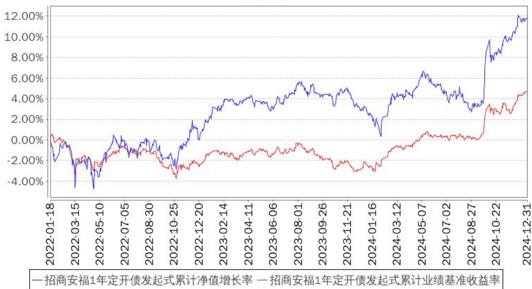
招商安福1年定开债发起式累计净值增长率与同期业绩比较基准收益率的历史走势对比图