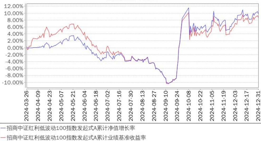
招商中证红利低波动100指数发起式A累计净值增长率与同期业绩比较基准收益率的历史走势对比图