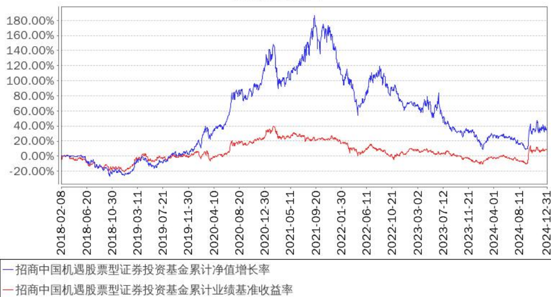
招商中国机遇股票型证券投资基金累计净值增长率与同期业绩比较基准收益率的历史走势对比图