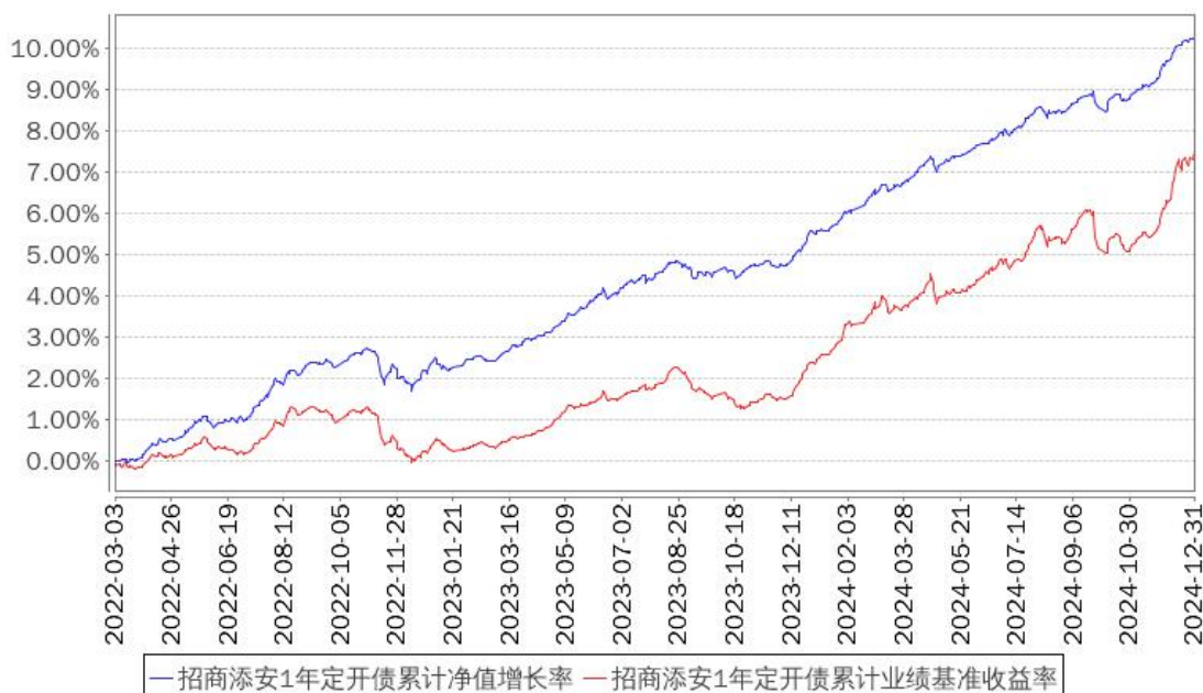
招商添安1年定开债累计净值增长率与同期业绩比较基准收益率的历史走势对比图