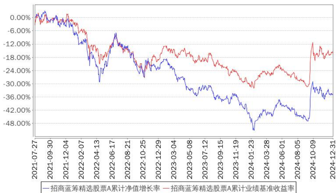
招商蓝筹精选股票A累计净值增长率与同期业绩比较基准收益率的历史走势对比图