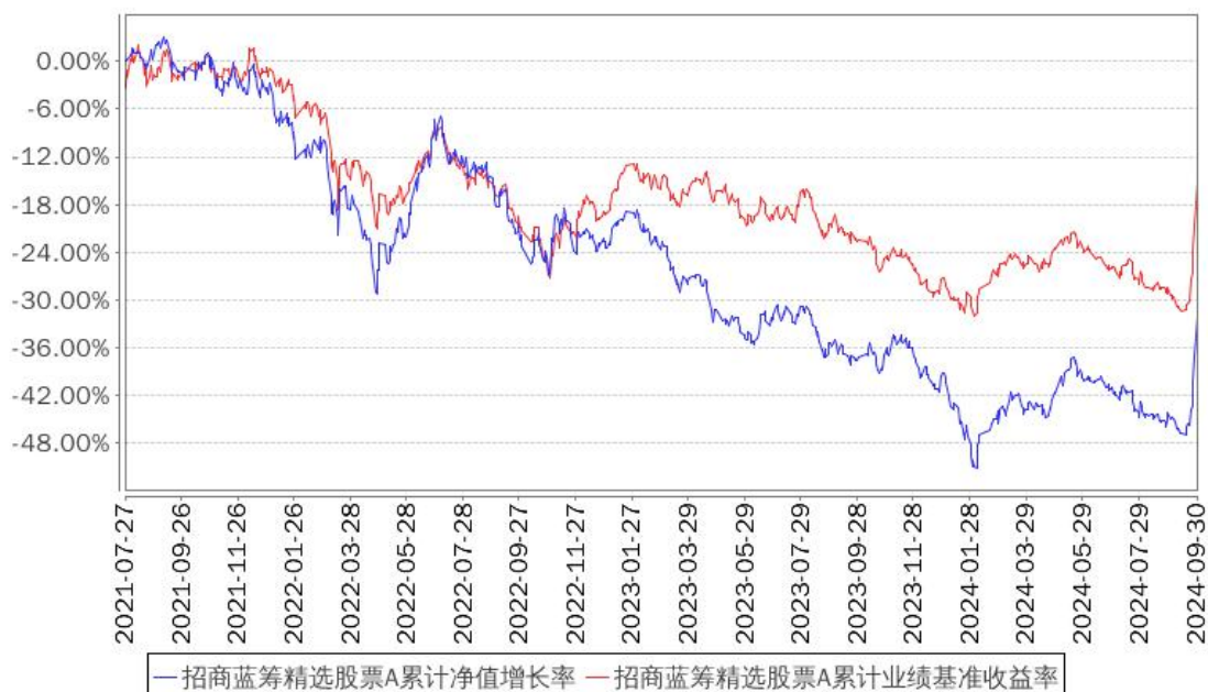
招商蓝筹精选股票A累计净值增长率与同期业绩比较基准收益率的历史走势对比图