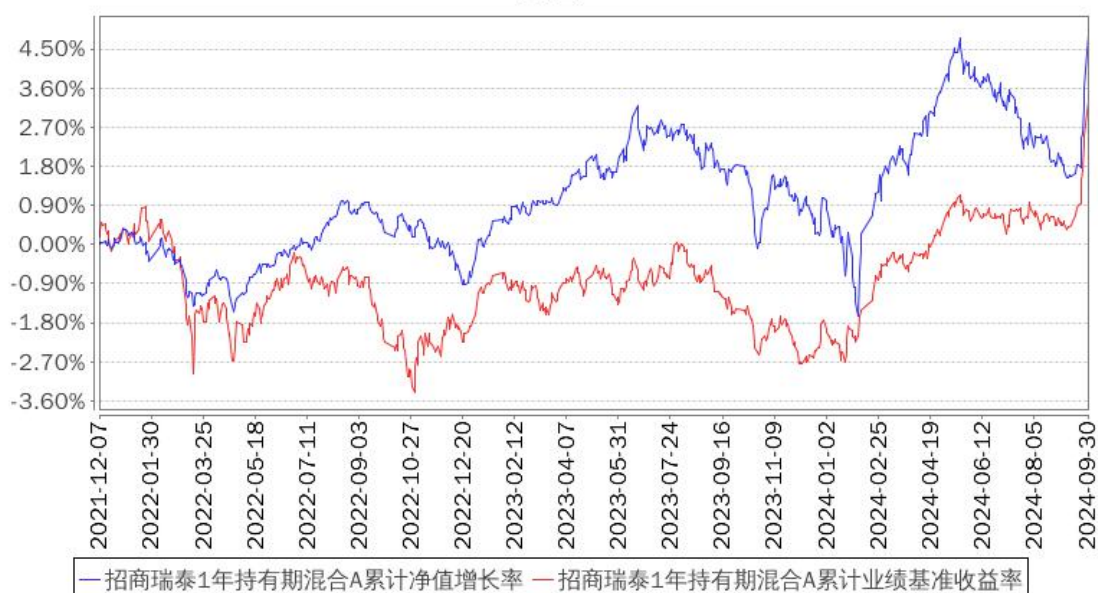
招商瑞泰1年持有期混合A累计净值增长率与同期业绩比较基准收益率的历史走势对比图