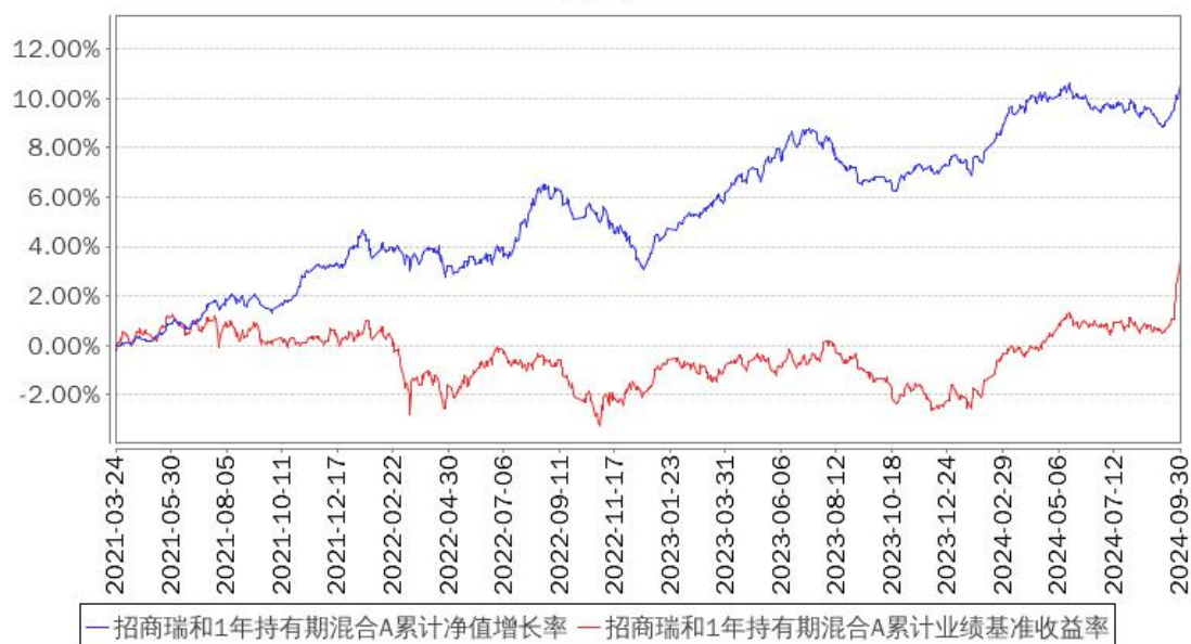
招商瑞和1年持有期混合A累计净值增长率与同期业绩比较基准收益率的历史走势对比图