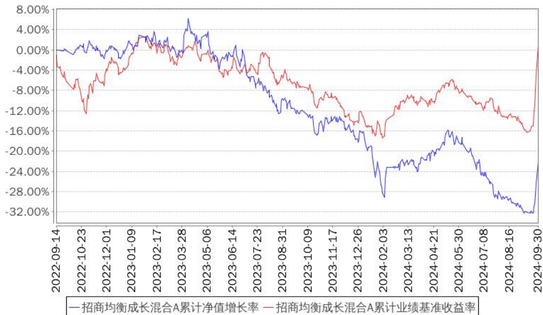
招商均衡成长混合A累计净值增长率与同期业绩比较基准收益率的历史走势对比图