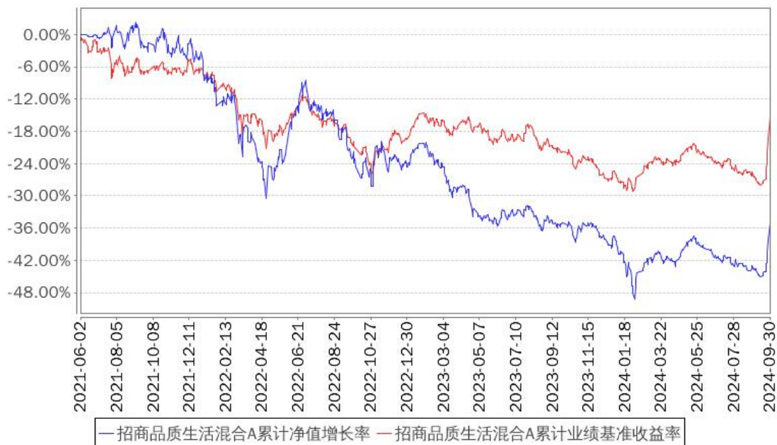
招商品质生活混合A累计净值增长率与同期业绩比较基准收益率的历史走势对比图