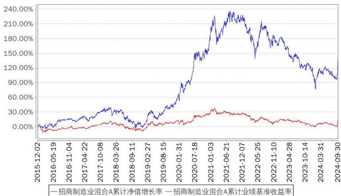
招商制造业混合A累计净值增长率与同期业绩比较基准收益率的历史走势对比图