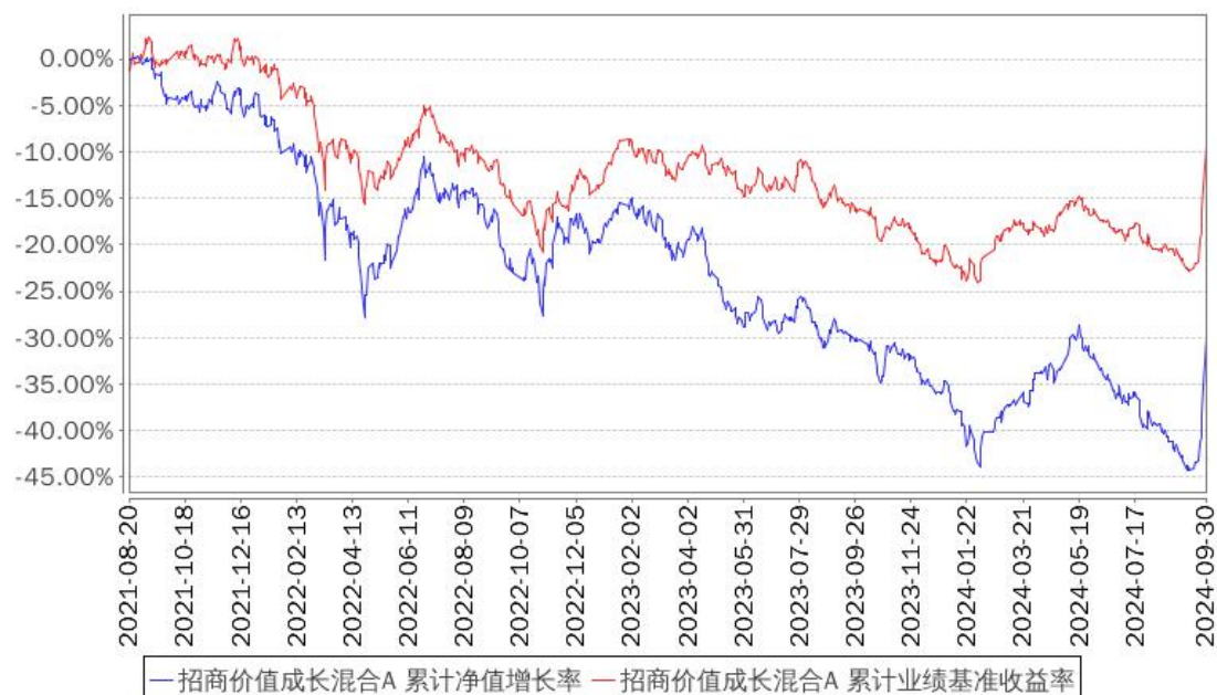
招商价值成长混合A 累计净值增长率与同期业绩比较基准收益率的历史走势对比图