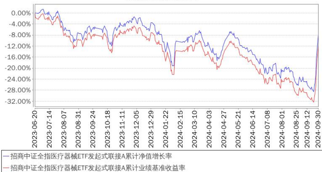
招商中证全指医疗器械ETF发起式联接A累计净值增长率与同期业绩比较基准收益率的历史走势对比图