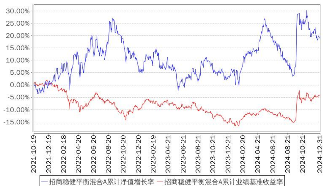
招商稳健平衡混合A累计净值增长率与同期业绩比较基准收益率的历史走势对比图