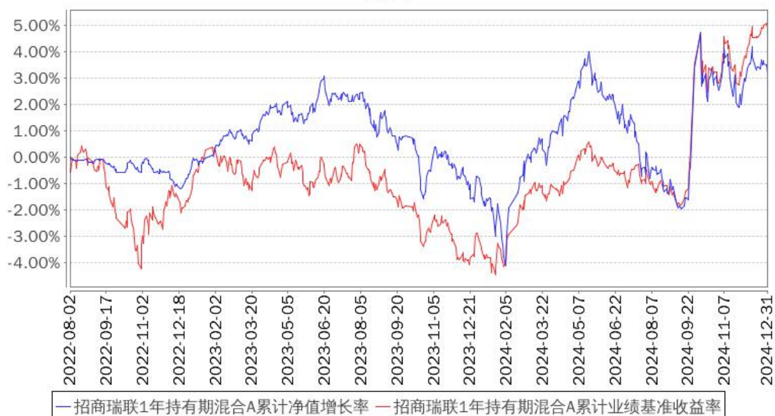
招商瑞联1年持有期混合A累计净值增长率与同期业绩比较基准收益率的历史走势对比图