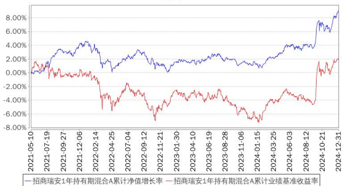
招商瑞安1年持有期混合A累计净值增长率与同期业绩比较基准收益率的历史走势对比图