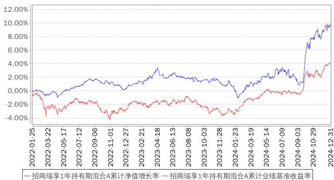
招商瑞享1年持有期混合A累计净值增长率与同期业绩比较基准收益率的历史走势对比图