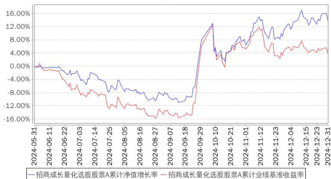
招商成长量化选股股票A累计净值增长率与同期业绩比较基准收益率的历史走势对比图