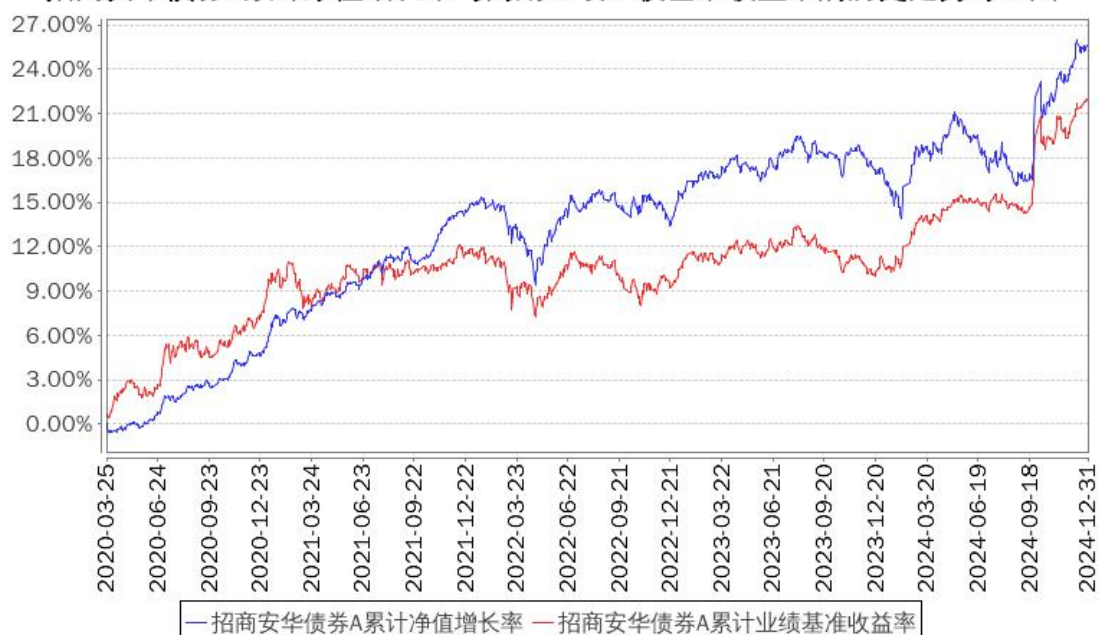
招商安华债券A累计净值增长率与同期业绩比较基准收益率的历史走势对比图