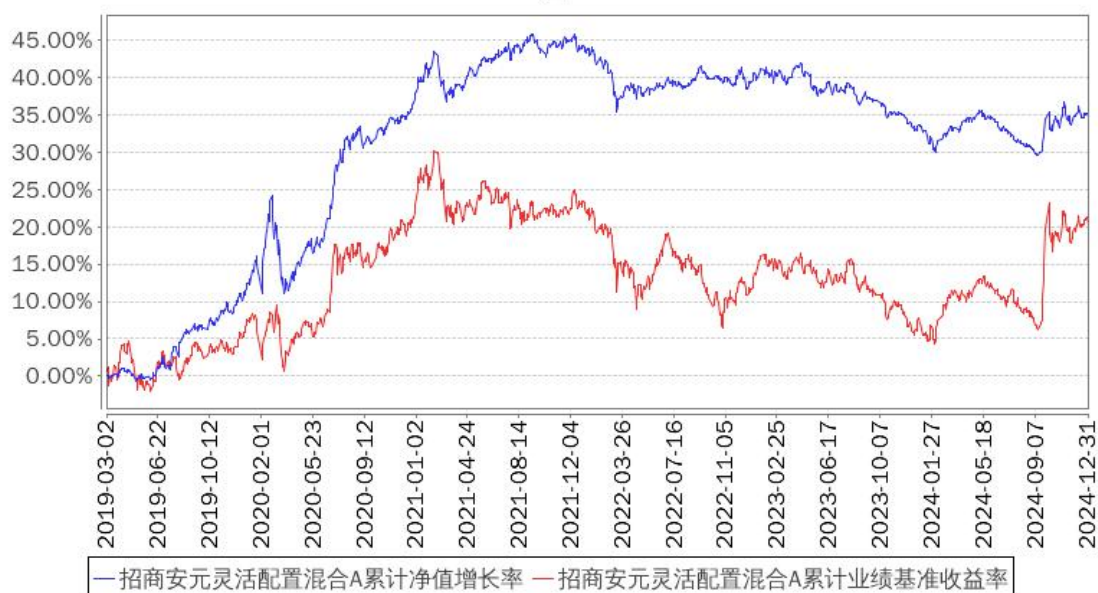
招商安元灵活配置混合A累计净值增长率与同期业绩比较基准收益率的历史走势对比图