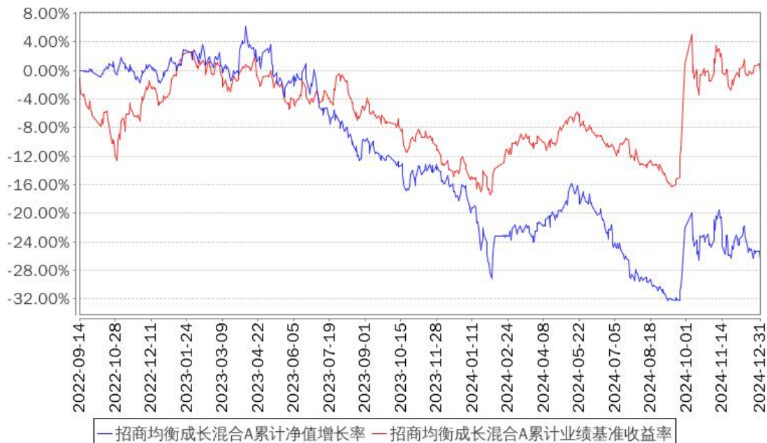
招商均衡成长混合A累计净值增长率与同期业绩比较基准收益率的历史走势对比图