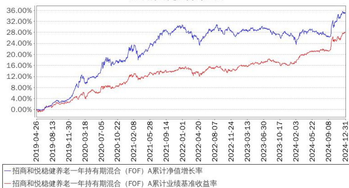
招商和悦稳健养老一年持有期混合 (FOF) A 累计净值增长率与同期业绩比较基准收益率的历史走势对比图