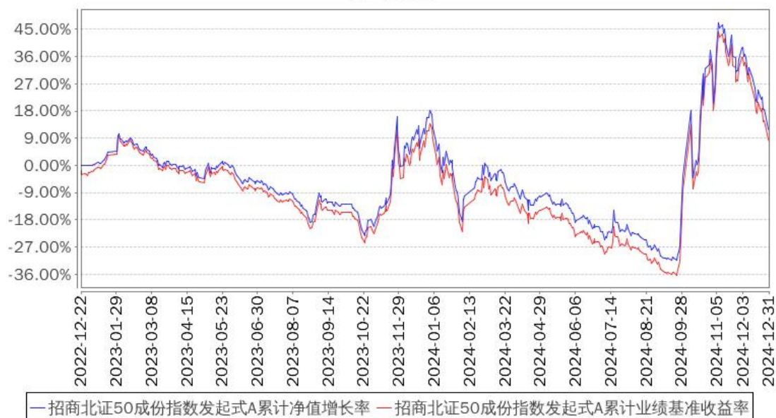
招商北证50成份指数发起式A累计净值增长率与同期业绩比较基准收益率的历史走势对比图